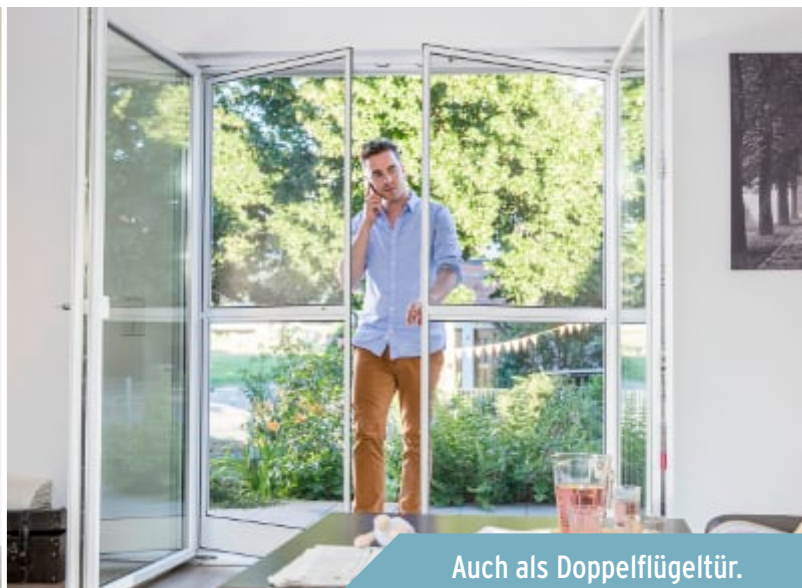
Auch als Doppelflügeltür.