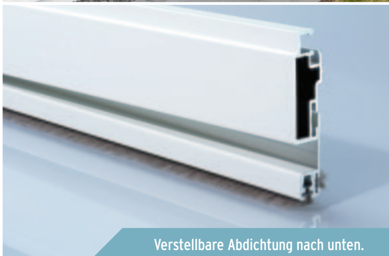
Verstellbare Abdichtung nach unten.