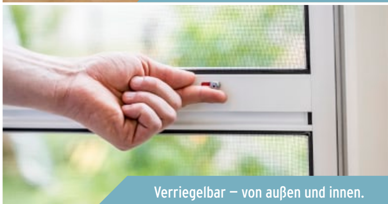
Verriegelbar – von außen und innen.

Die patentierte Zapfen-Beschlag-Technik ermöglicht einen Öffnungswinkel von 120 Grad. Das schont nicht nur das Material, sondern eröffnet Ihnen einen bequemen Durchgang. Auch für Stulptüren hat Neher eine passende Pendeltür-Lösung im Programm.