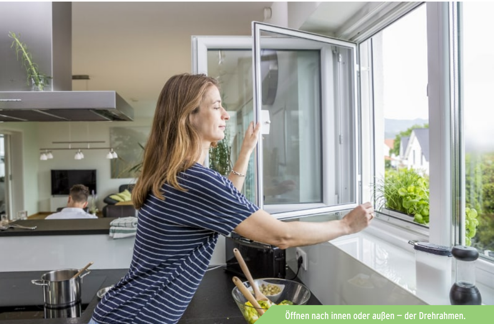
Öffnen nach innen oder außen – der Drehrahmen.

Wenn Sie Ihre Fenster häufig öffnen und schließen, beispielsweise zum Blumen gießen, sind Dreh- oder Pendelfenster als Insektenschutz die ideale Wahl. Sie sind einfach und schnell zu bedienen, robust, stabil und unauffällig. Die Scharniere und die ergonomischen Griffe sind aus Metall, damit sie auch nach jahrelangem Gebrauch noch zuverlässig funktionieren und optisch ansprechend bleiben.