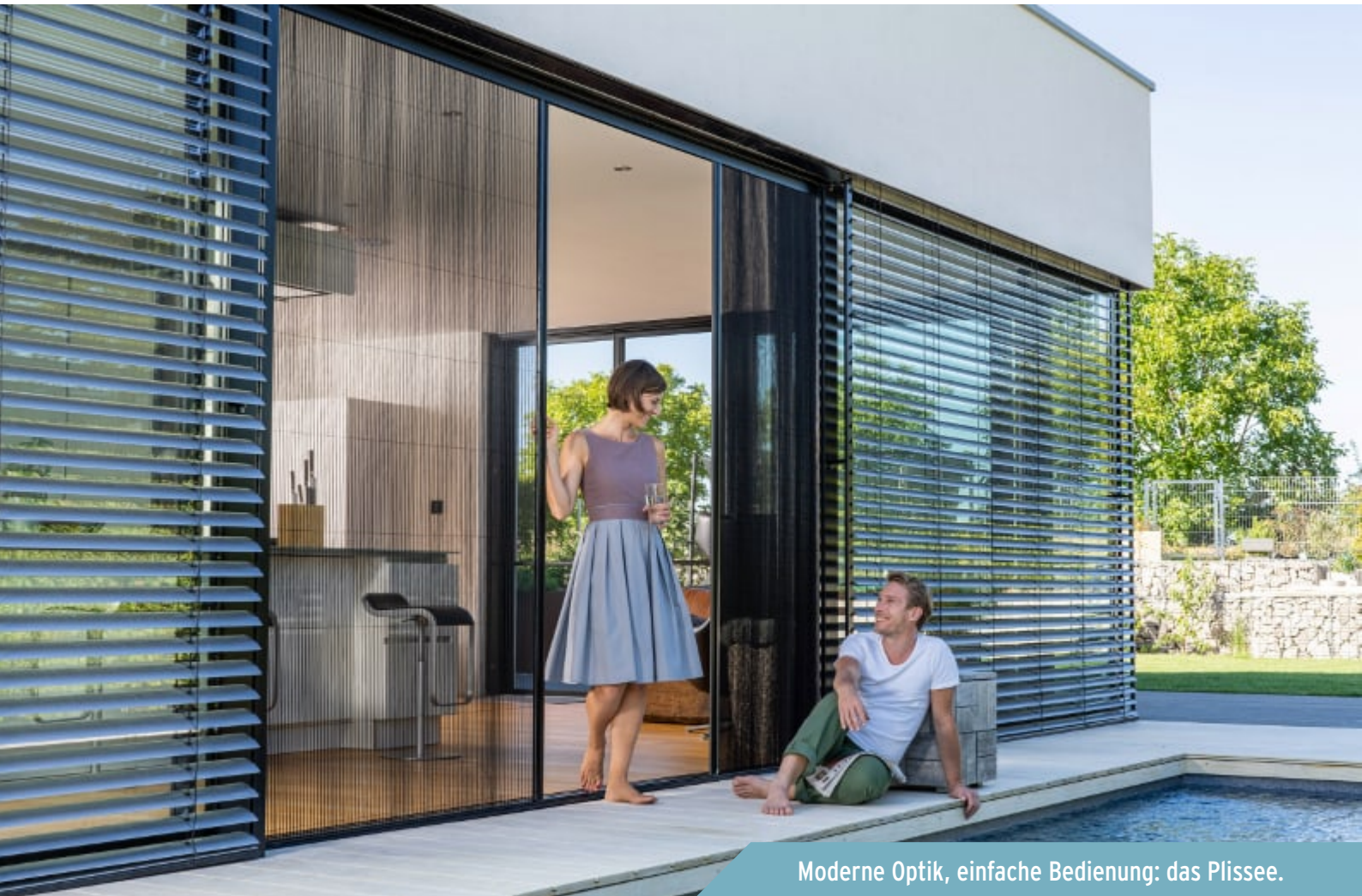
Moderne Optik, einfache Bedienung: das Plissee.

Das Insektenschutz-Plissee besticht durch eine außergewöhnliche Optik, die sich an Sonnenschutz-Plissees orientiert. Seinen Namen verdankt es der Plissierung (Faltung) des witterungsbeständigen Gewebes. Es benötigt keinen Schwenkbereich und ist platzsparend einsetzbar. Das Plissee ist kinderleicht zu bedienen und praktisch schwellenfrei.