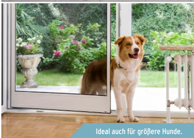
Ideal auch für größere Hunde.